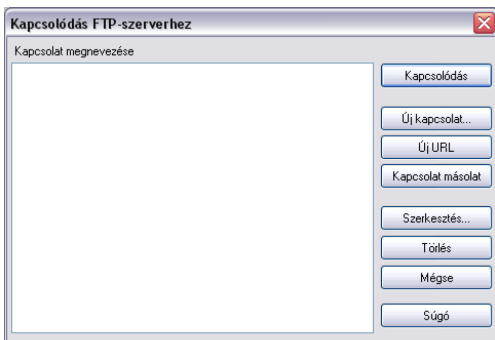
2. ábra: Kapcsolódás FTP-szerverhez